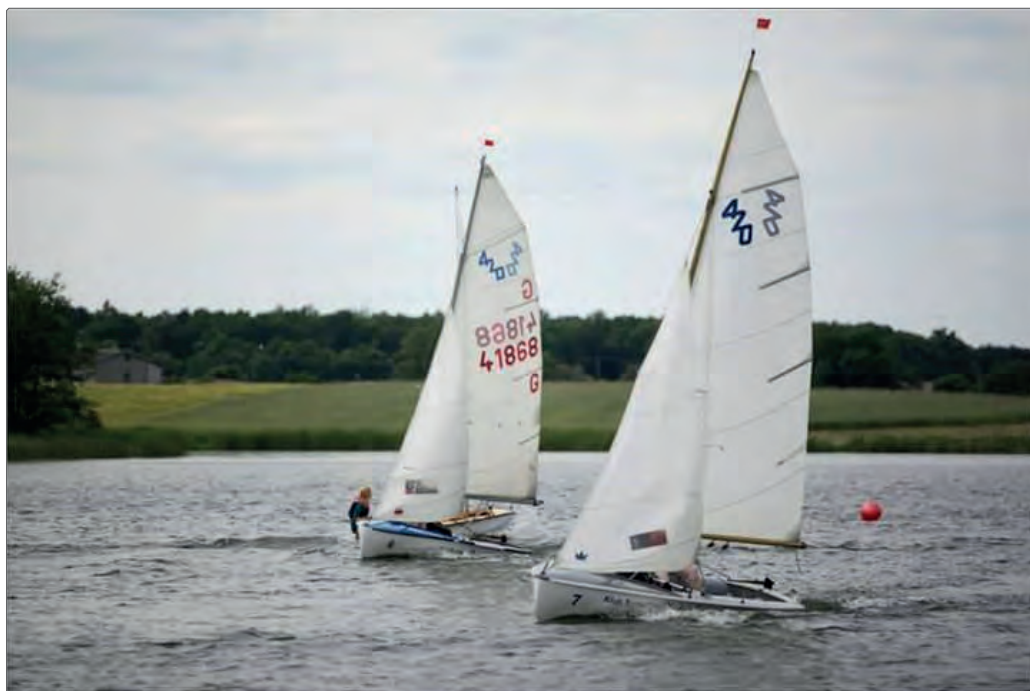
1 - KŻ Wodniak - 31.05.2015 nad Zalewem Roszkowskim 2 - KŻ Wodniak - Regaty o Puchar Komandora Klubu