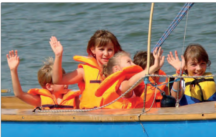
1 - Puchar Burmistrza Miasta i Gminy Pleszew - otwarcie sezonu 2012